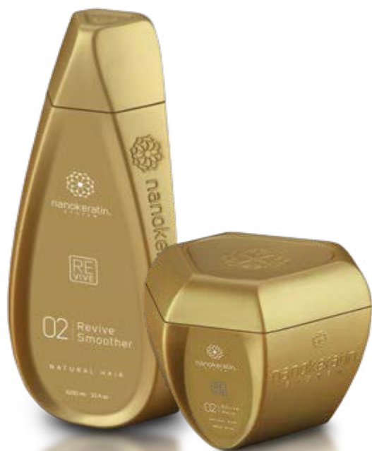
REVIVE Ubehandlet hår

nanoSmooth Pure er et nyskapende system med avansert teknologi for gjenoppretting utglatting og retting. Systemet inneholder ikke formaldehyd eller aldehyder og det oppstår ingen kjemisk avgassing hverken under eller etter behandling. Produktene er basert på banebrytende molekylær og biomimetisk teknologi og komplimenteres av pleieprodukter for å ivareta et perfekt resultat hjemme. Refine, Revive og Replenish gir antifrizzbehandlinger og utglatting på normale hår.