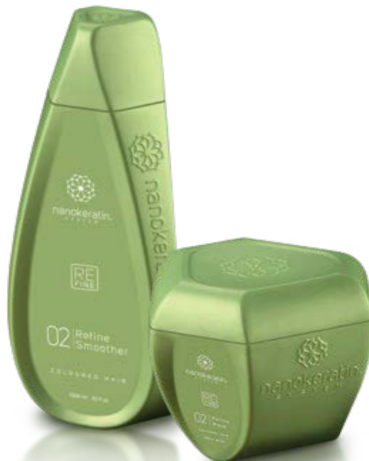
REFINE Farget hår