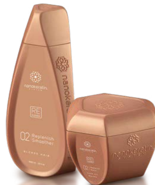
REPLENISH Blondt hår