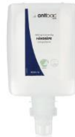
Antibac® Håndsåpe til Modell X SMART & EASY art. nr. 606003