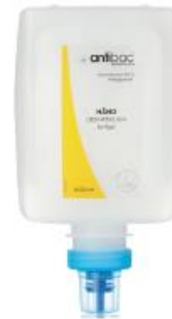
Antibac® Hånddesinfeksjon softgel til Modell X SMART & EASY art. nr. 606002