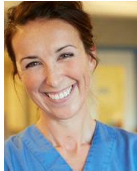
Distribusjon hos landets ledende forhandlere og grossister