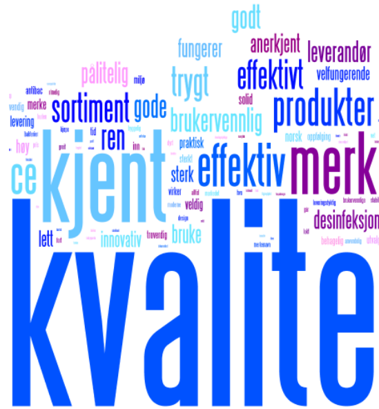
Eksperten i markedet