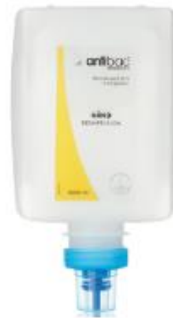
Antibac® Hånddesinfeksjon flytende til Modell X SMART & EASY art. nr. 606001