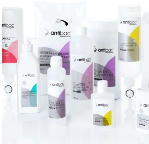
Markedsleder på desinfeksjon