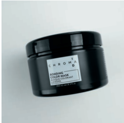
ChromaID krukke Logo og produktinformasjon er printet på allerede