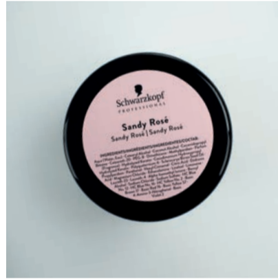
Klistrelapp hvor man gir sin kreative mix et navn eller hvilket blandingstips man har brukt.