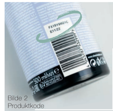
Bilde 2 Produktkode